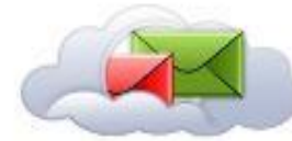
Hosted Email Security