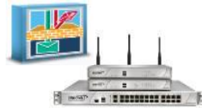
Comprehensive Anti-Spam Service (CASS)